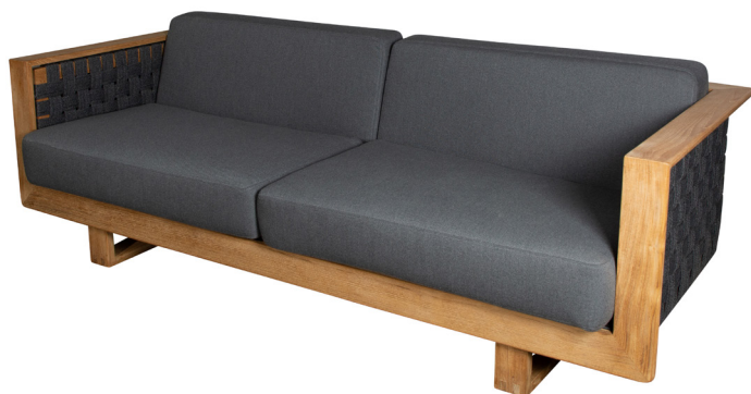
RODGAITLT Dark grey/Teak