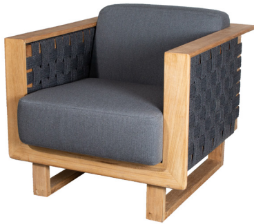
RODGAITLT Dark grey/Teak